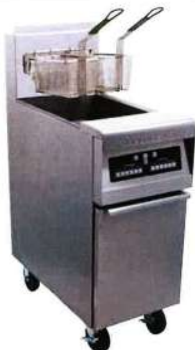
Modèle présenté avec roulettes et computer en option