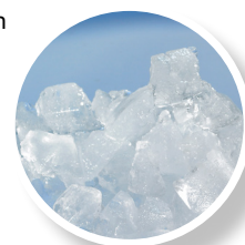
Glace super grain