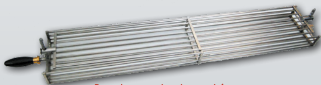
Broche panier brevetée