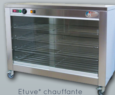
Étuve* chauffante pour MAP E