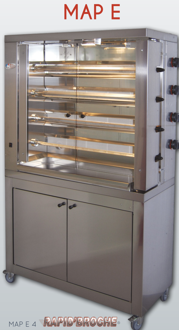
MAP E 4 RAPID'BROCHE ® sur placard